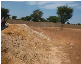
Mögliche Fläche für einen Frauengarten