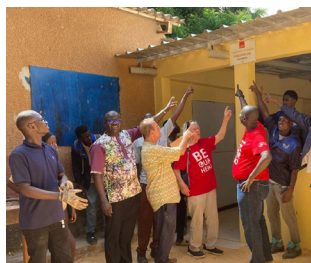
Partnerprojekt mit der Stiftung Tools for Life