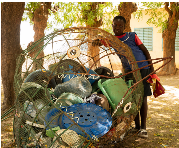
Altplastiksammlung an Schulen