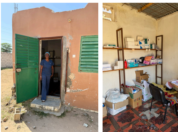
Apotheke in Palléne

Das Gebäude der Apotheke in unserer Krankenstation Palléne muss erneuert werden. Bei der letzten Begehung durch das zuständige Gesundheitskomitee wurde der marode Zustand bemängelt. Wegen der Vergrößerung der Krankenstation wird zudem mehr Platz zur Lagerung der Medikamente benötigt und für Impfstoffe und Medikamente braucht es einen Kühlschrank. Frau Seynabou, die zuständige Krankenschwester, freut sich sehr auf die neue Apotheke.