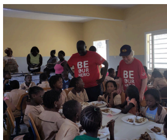
Kinder an der Schule St. Augustin

Voller Vorfreude wurde in der Berufsschule „Don Bosco“ in Thiès die Einführung der Berufsschulbildung für Installateure erwartet. Im Berichtsjahr konnten wir mit unserem Partner, der Stiftung „Tools for Life“, diesen Ausbildungszweig realisieren. Neben der Investition in die Schulräume wurde auch der Lehrplan mitgestaltet. Dies ist ein wegweisendes Projekt im Bereich der Berufsausbildung im Senegal.