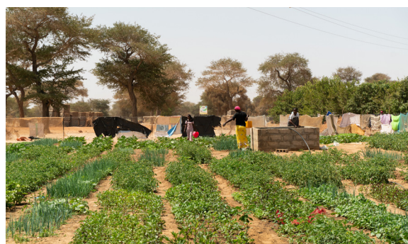
Blick in die Gartenanlage

Der Bau des Brunnens mit Hochbehälter und Tropfbewässerung in Keur Yoro Safie konnte abgeschlossen werden. Mit Hilfe des Wassers aus dem neuen Brunnen war es möglich, einen Garten für die Frauengruppe anzulegen. Die Frauen bauen aktuell verschiedene Gemüsesorten wie Zwiebeln, Maniok, Piment und Auberginen an. Um ein schnelles Verdunsten des Wassers zu verhindern, wurden zwischen den Beeten schattenspendende Mangobäume gepflanzt.