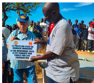
Hochbehälter für die Tropfbewässerung

Die Mensa der Grundschule St. Augustin in Thiès ist mittlerweile fertiggestellt und die über 1000 Schülerinnen und Schüler können mit einem Mittagessen versorgt werden. Für einige Kinder ist dies die einzige warme Mahlzeit am Tag. Für bedürftige Familien werden die Kosten für das Essen über Schulpatenschaften von „Wasser für Senegal e.V.“ finanziert.