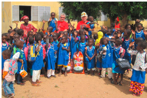
Reisübergabe an der Schule in Mbouleme