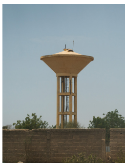
Wasserturm in Pallo

Unser Leuchtturmprojekt in Pallo, fertiggestellt im Jahr 2017, versorgt sieben Dörfer mit Trinkwasser. Seitdem begleiten wir das Projekt und leisten Hilfe bei Problemen. Im vergangenen Jahr hatte die Anlage einen Pumpenausfall, den wir beheben konnten. Für das kommende Jahr wollen wir den Gemeinschaftsgarten in den Blick nehmen. Wir unterstützen die Genossenschaft vor Ort, um die Agrarflächen für eine nachhaltige Nutzung vorzubereiten.