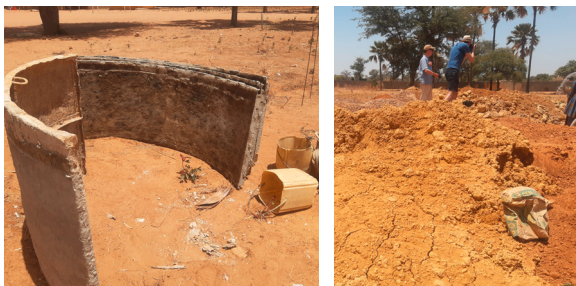
Brunnenschalung für den Brunnenbau

Da der Grundwasserspiegel des Brunnens im Dorf Thilla Boubou niedriger ist, als erwartet und deshalb nicht ausreichend Wasser zur Verfügung stand, musste tiefer gegraben werden. Zurzeit findet eine Überprüfung der Wassermenge und Wasserqualität statt. Sollten die Ergebnisse gut sein, werden eine Solarpumpe, ein Hochbehälter und Tropfbewässerungsschläuche installiert.