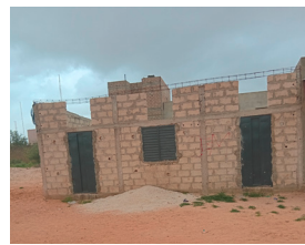
Klassenzimmer ohne Dach

Die Realschule Fahu am Stadtrand von Thiès ist in einem sehr schlechten Zustand. Aus der Not heraus hat eine Elterninitiative mit dem Elternbeirat drei Klassenzimmer mit eigenen Mitteln gebaut. Beim letzten Raum fehlt noch die Überdachung. Aufgrund der fehlenden Räumlichkeiten sitzen