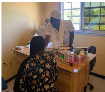
Behandlungsraum in der Krankenstation