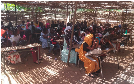
Strohklassenzimmer als Behelf

In Ngascop gibt es zu wenige Klassenräume, weil die Schülerzahl aus den 18 umliegenden Dörfern stark gestiegen ist. Zurzeit finden nicht alle Schüler einen Platz an der Schule. Da es die einzige weiterführende Schule in der Region ist, sehen wir eine Erweiterung als dringend notwendig.